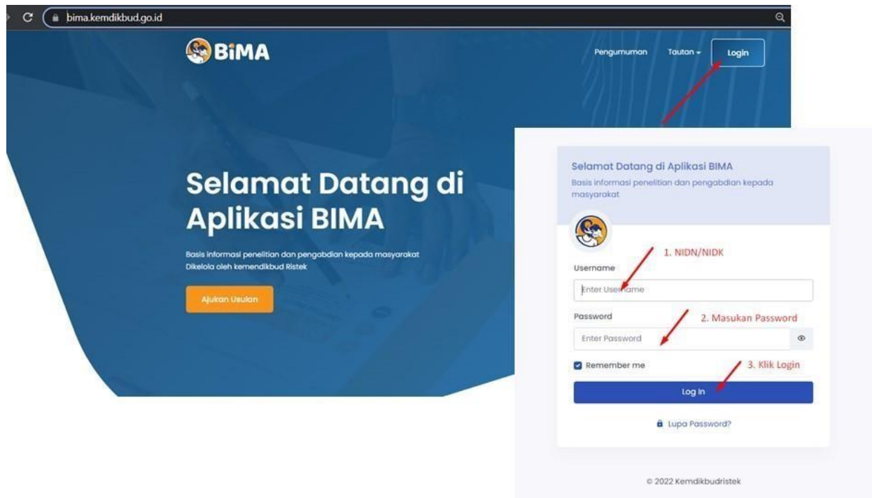
Gambar 1. Beranda akses memasuki aplikasi BIMA

Penerima pendanaan bantuan biaya luaran prototipe di Perguruan Tinggi Akademik Tahun Anggaran 2023, wajib melakukan revisi proposal, rencana anggaran biaya (RAB), dan mengunggah surat pernyataan kesanggupan melalui aplikasi BIMA pada laman http://bima.kemdikbud.go.id/ dengan menggunakan akun ketua pengusul masing-masing, sebagaimana diperlihatkan pada Gambar 1.